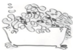
SKUMBADET – det fænomenologiske moment

At dykke ned i en levet erfaring fra (arbejds)livet. Hvad kalder på mig? Hvad længes jeg efter?