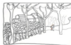
MY WAY – det eksistentielle moment

At finde mig selv i det tænkte og sagte. Hvem er jeg selv i alt dette?