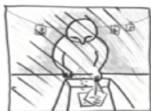
MØRKEKAMMERET – det hermeneutiske moment

At fortolke det levede. Hvilke værdier ligger bag? Kunne det være anderledes?