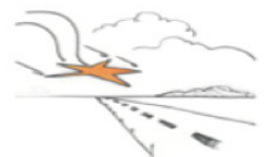
LANDING – det phronesiske moment

At lande i egen praksis igen. Hvilken praktisk visdom har vi opnået? Hvordan gøre verden bedre nu? Hvad skal første skridt være?